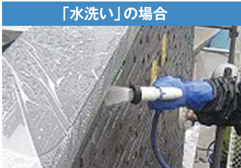
流水で十分に洗い流します。