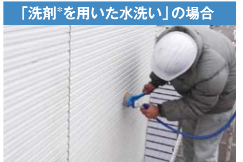
食器洗い用洗剤などを用いて、柔らかい布やブラシで洗浄し、その後流水で十分に洗い流します。