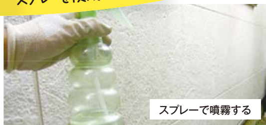
スプレーで噴霧する