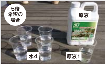
▲専用クリーナーと水