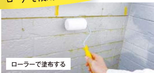
ローラーで塗布する